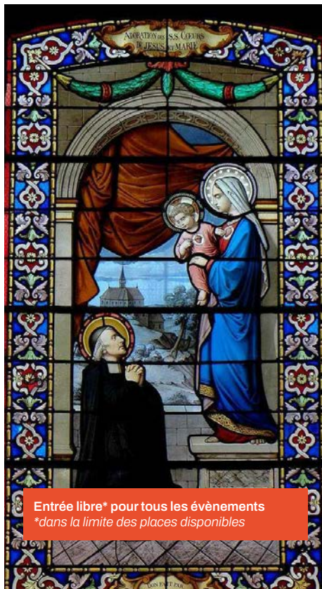
Entrée libre* pour tous les événements *dans la limite des places disponibles