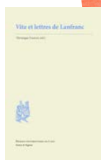
1 & 2 © Editions Petit à Petit / 3 © Éditions Orep / 4 © Presses universitaires de Caen